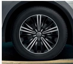
Nizza 7J x 18