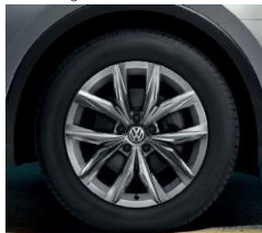
Kingston 7J x 18