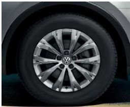
Montana 7J x 17